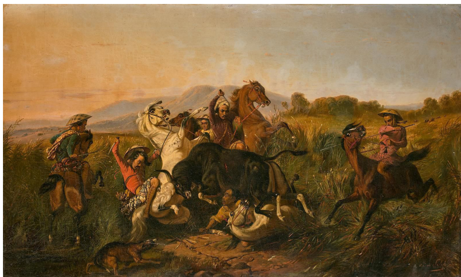
Raden Saleh (1811/1814-1880), La Chasse au taureau sauvage , 1855, huile sur toile, 110×180 cm.