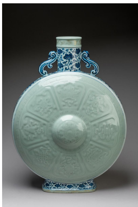
Gourde Baoyueping, Chine, époque Qianlong (1736-1795), porcelaine émaillée céladon.

Une gourde en porcelaine vendue 5,084 millions € par Rouillac le 10 juin 2018 à Montbazon.