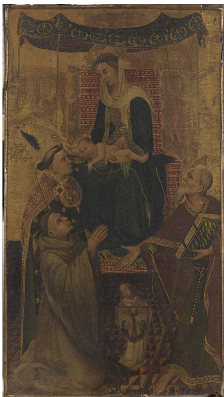
Ecole française vers 1400-1410, Moine franciscain en prière devant la Vierge et l'Enfant Jésus , tempera sur panneau, 42×23 cm.

Un panneau du XVe siècle vendu 1,3 million € par De Baecque et Associés le 12 novembre 2018 à Lyon