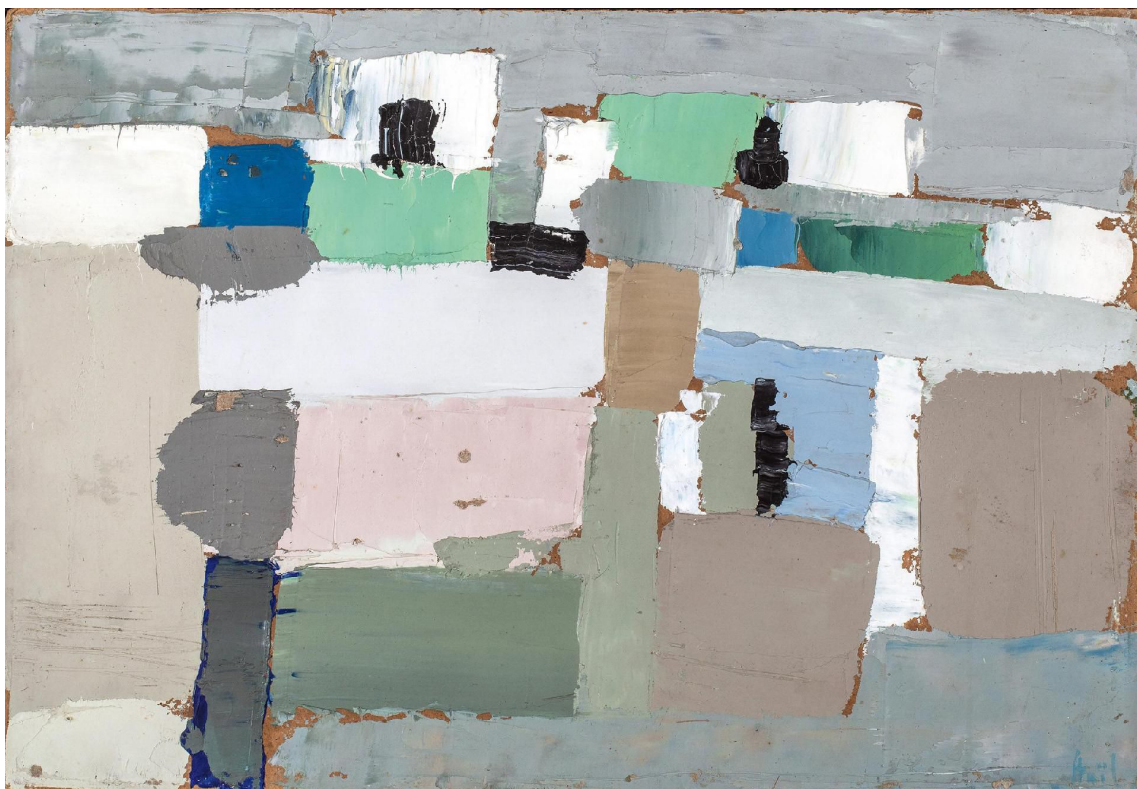
Nicolas de Staël (1913-1955), Paysage (La Ciotat) , 1952, huile sur carton, 38x55 cm.

Une huile sur carton de Nicolas de Staël vendue 1,029 million € par Versailles Enchères le 16 décembre 2018 à Versailles.