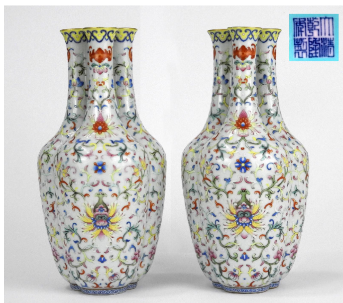
Paire de vases, Chine, époque Qianlong, porcelaine à décor en émaux polychromes, H. :25 cm.

Une paire de vases vendue 1,07 million € par Pousse-Cornet le 23 juin 2018 à Blois.