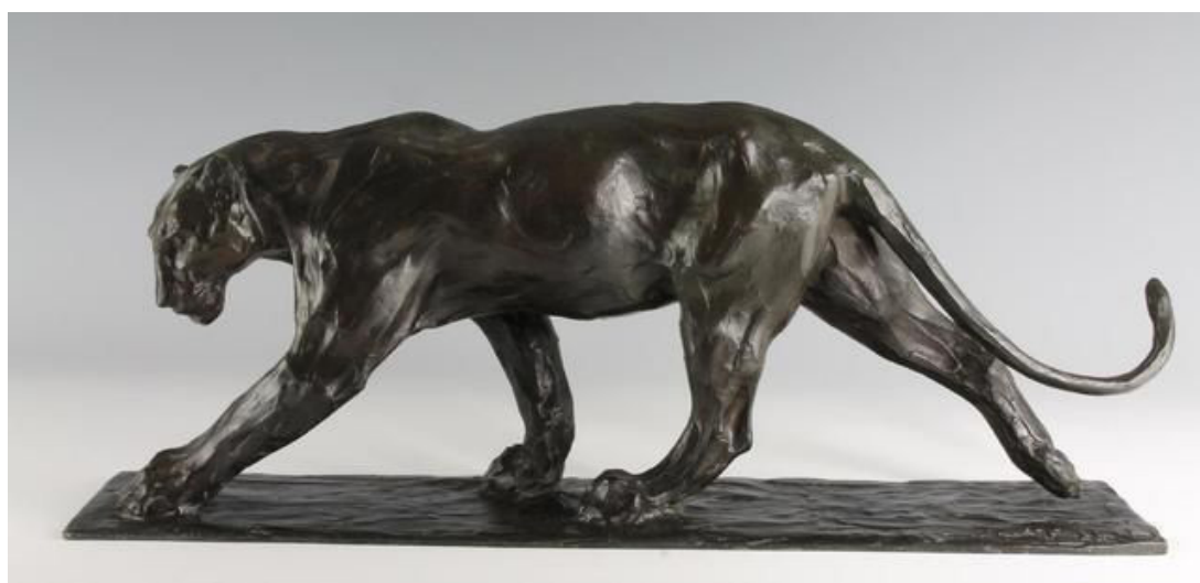
Rembrandt Bugatti (1884-1916), Panthère marchant, patte arrière levée , bronze à patine nuancée de brun et noir, fonte à cire perdue, 21,2×51,5×11,3 cm.

Un bronze de Rembrandt Bugatti vendu 566 400 € par Bailleul et Nentas le 02 avril 2018 à Bayeux.