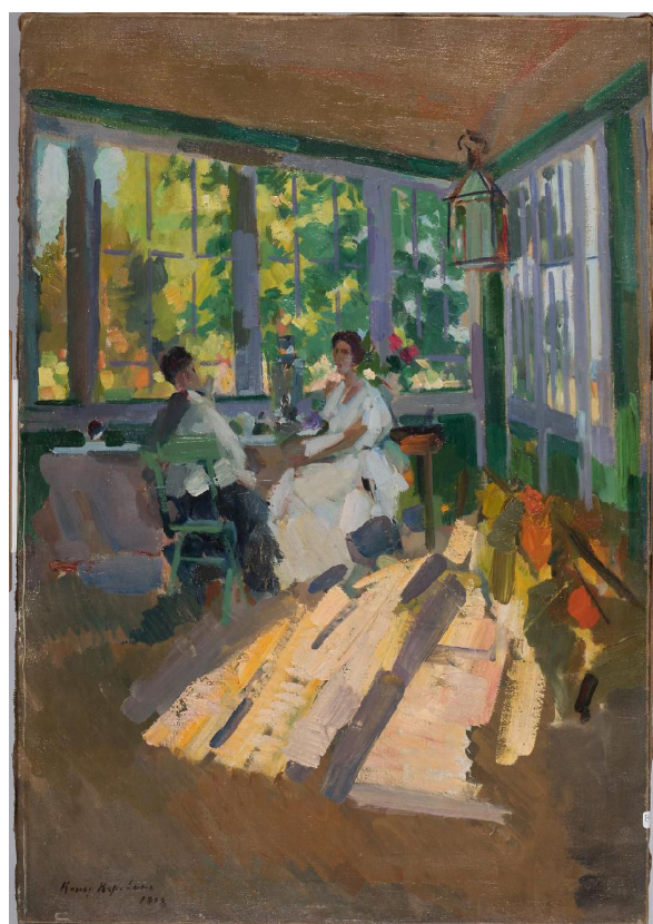
Constantin Alexeïevitch Korovine (1861-1939), La Véranda , 1922, huile sur toile, 87×64,5 cm.