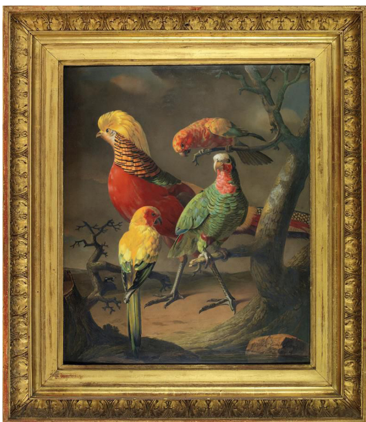
Jacques Barraband (1768-1809) et manufacture de Dhl et Guerhard, 1797-1798, peinture sur plaque en porcelaine, 59,5×49,3 cm.

Une peinture sur porcelaine vendue 565 600 € par Briscadieu le 17 novembre 2018 à Bordeaux.