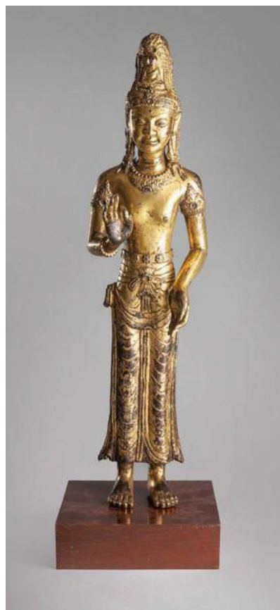
Statue Acuoeye Guanyin, Royaume de Dali, XIIe siècle, bronze doré.

Une statue du Royaume de Dali vendue 762 500 € par Collin du Bocage le 12 décembre 2018 à Paris.