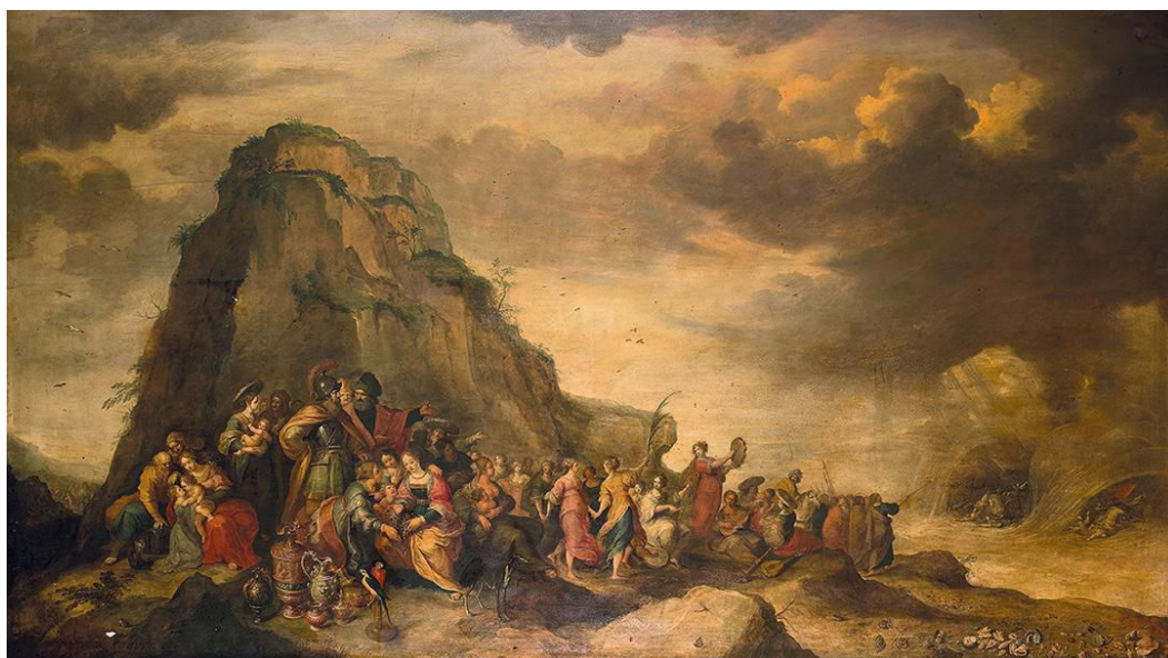
Frans Francken II (1581-1642), Moïse et les enfants d'Israël chantant et dansant après le passage de la mer Rouge , panneau parqué, 118x213,5 cm.

Un panneau de Frans Francken II vendu 1,5 million € par Boisseau-Pomez le 29 septembre 2018 à Troyes.