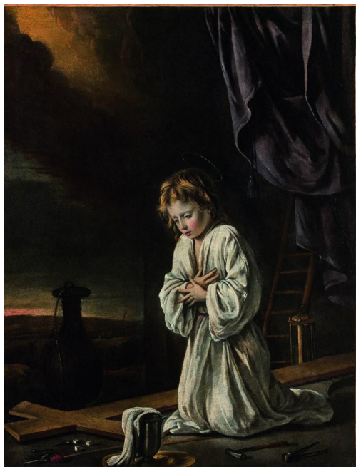
Les Frères Le Nain (XVIIe siècle), L'Enfant Jésus méditant sur les instruments de la Passion , huile sur toile, 72x59 cm.

Une huile sur toile des Frères Le Nain vendue 3,6 millions € par Rouillac le 10 juin 2018 à Montbazou.